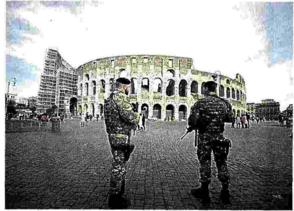
Colosseo presidato